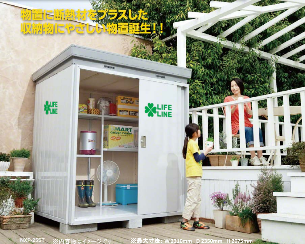
NXP-25ST ※内容物はイメージです ※最大寸法: W 2310mm D 2350mm H 2075mm