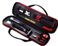
レスキューツールキット