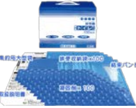
非常用トイレ 100回分×6個